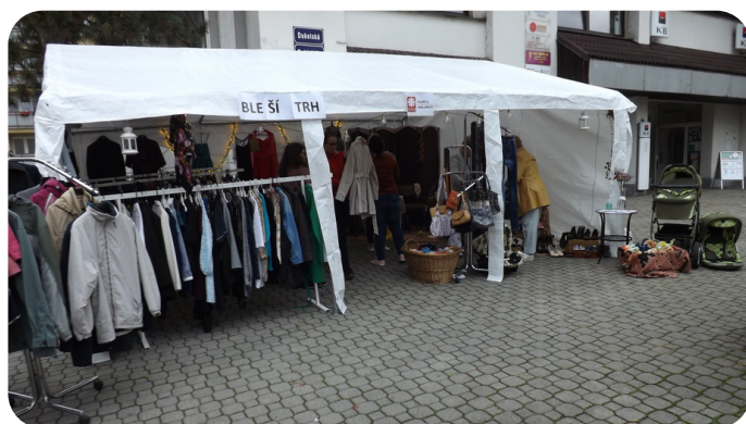
Bleší trh v rámci Týdne sociálních služeb.