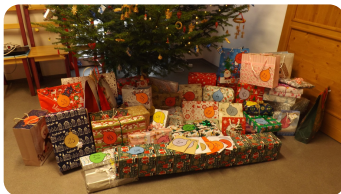
Vánoční dárky pro potřebné, které zorganizovali pracovníci TESCO Jablunkov.