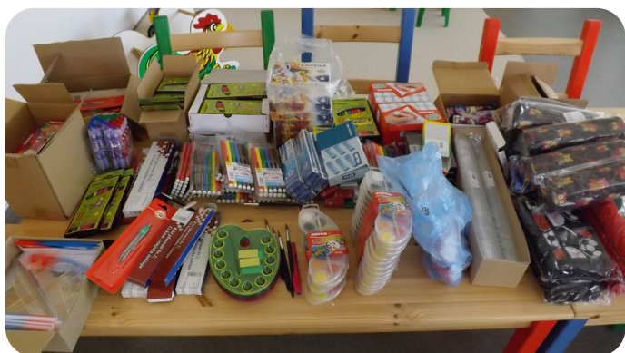
Školní pomůcky zakoupené z příspěvku Nadace Divoké husy.