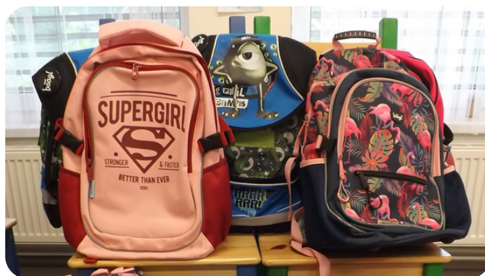
Aktovky věnované firmou PRESCO GROUP.