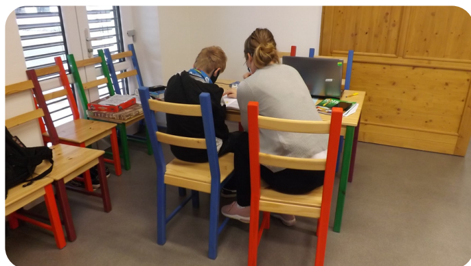
Doučování a online výuka v centru.