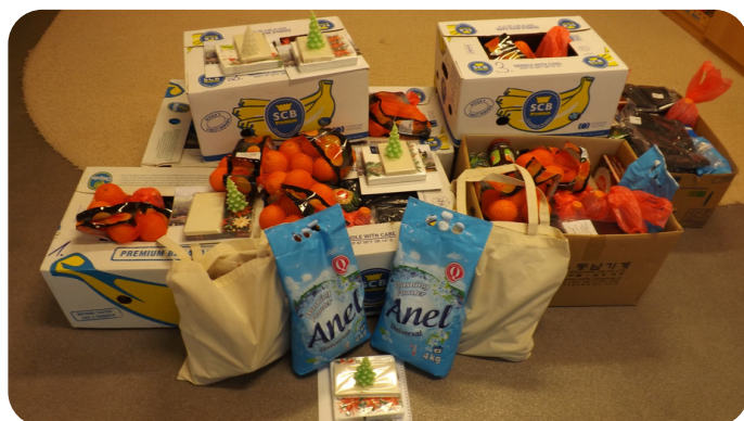
Vánoční potravinové balíčky pro potřebné, zakoupeno z darů akce: DAR SRDCE.