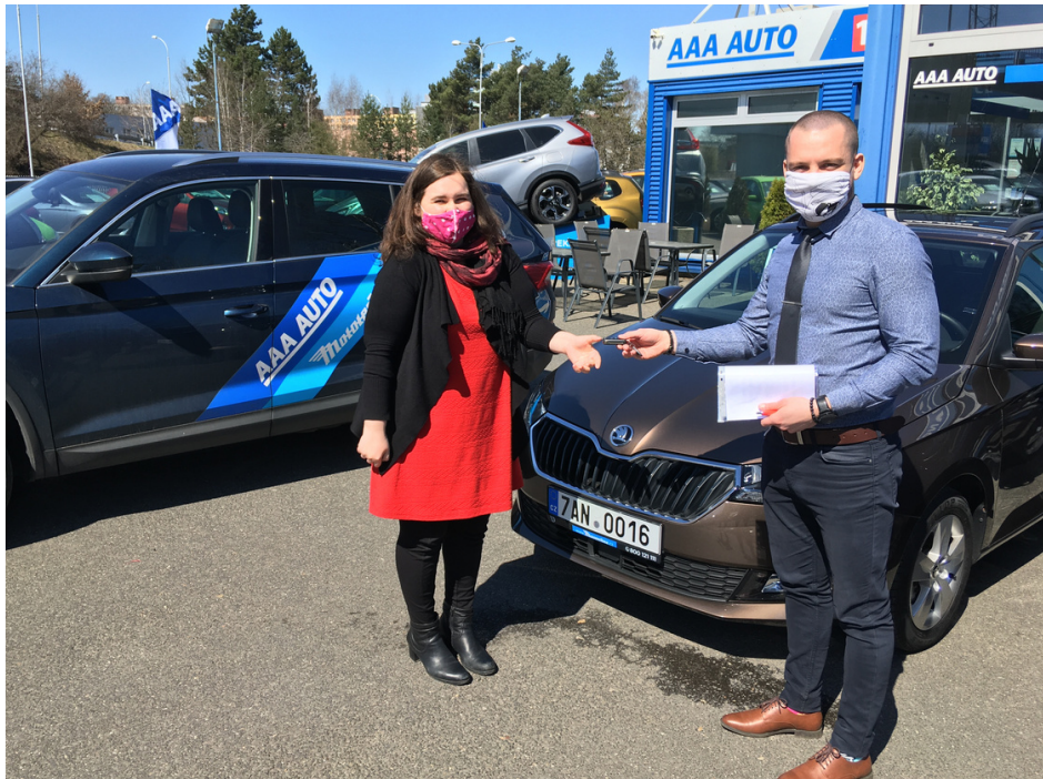
AAA AUTO, zapůjčení 2 automobilů Škoda Fabia: pracovní název: Hermína a Jeník