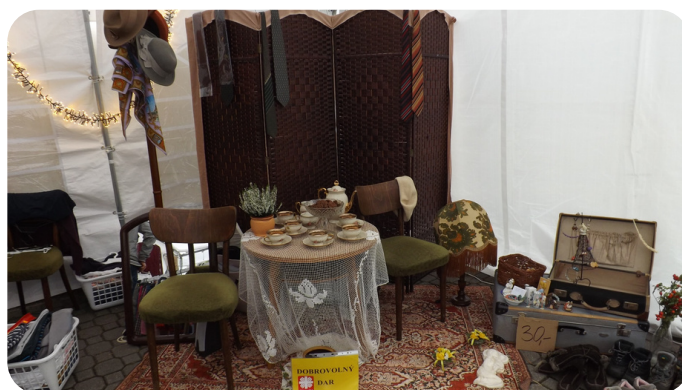
Bleší trh v rámci Týdne sociálních služeb.