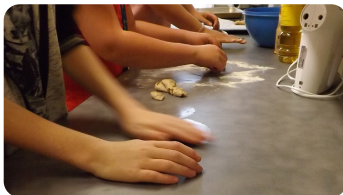
Děti pečou cukroví na Štědrovečerní večeři pro osamělé lidi.